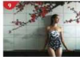
9 Crystal Life™ Spa Rejuvenate mind, body and soul with our holistic Western and Asian spa experience.