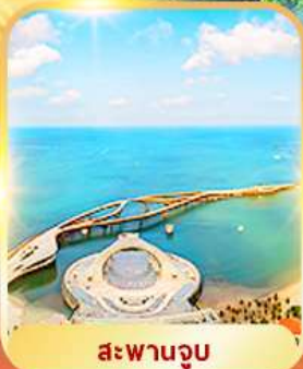
สะพานจวบ