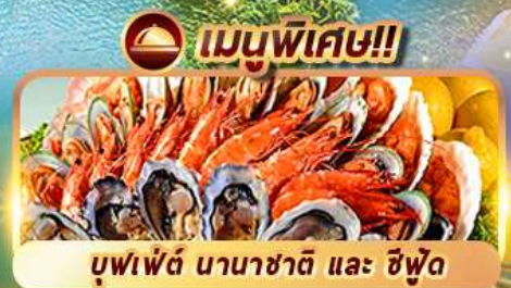
บุฟเฟต์ นานาชาติ และ ซิวัด