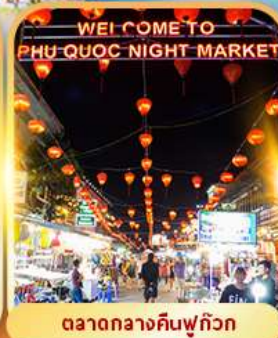
ตลาดกลางคืนฟู๊ควัก