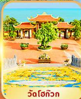
วัดโฮก๊วก