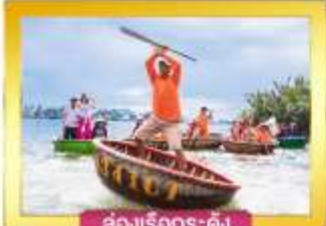
ล่องเรือกระดิง