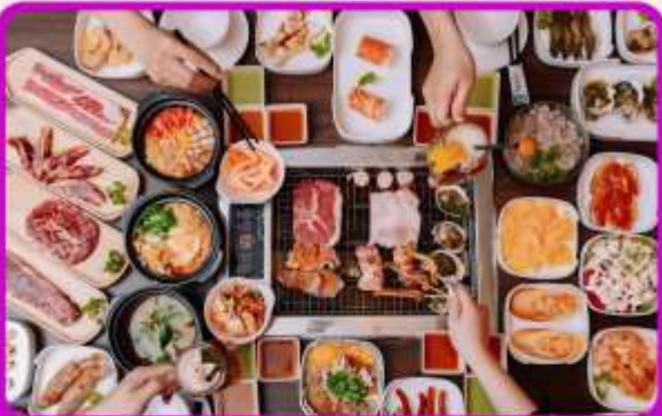
พิเศษ!! เมบูซาซิมิ+บุฟเฟ่ต์ปังอย่าง