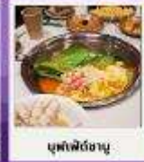
บุฟเฟ่ต์ถาญ