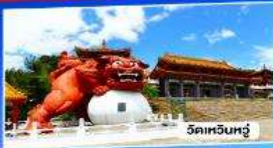
วัดเหวินหวู่

อาลีซาน ทะเลสาบสุริยันจันทรา จั๋วเฟิ่น 5วัน 3คืน