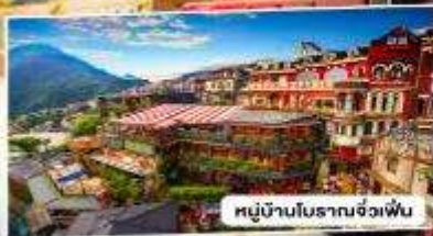
หมู่บ้านโบราณจั๋วเฟิ่น