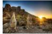
ชมพระอาทิตย์ขึ้น