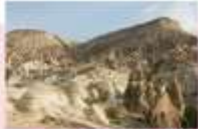
หุบเขาเคเฟเรนท์

** ที่พักที่ DEDELI CAVE HOTEL 5* หรือเทียบเท่า **