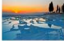
ปามุคคาเล่

** ที่พักที่ RICHMOND THERMAL HOTEL 5* หรือเทียบเท่า **