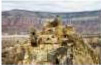
นครไต้ดิน