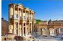
เมืองโบราณเอเฟซุส