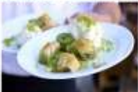
ชิมไอศกรีมตุรกีต้นกำเนิด Nemrut Mountain