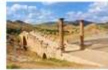
สะพานเซเวอร์วัน

19.20 น. เห็นฟ้าสูนครอิสตันบูล โดยเที่ยวบิน TK 2215