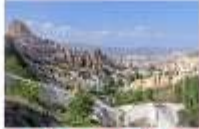
หมู่บ้านของนกพิราบ