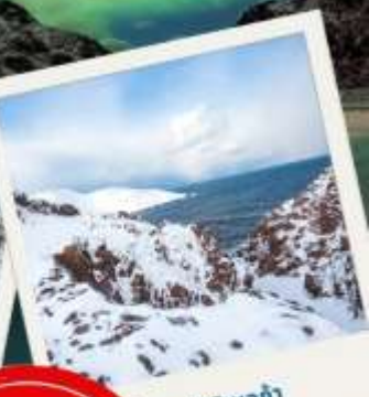
เทอริเบอก้า