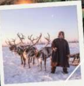
เมืองก็รอฟสค์