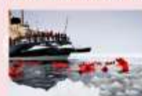
ล่องเรือตัดน้ำแข็ง Ice Breaker