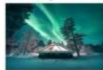
Glass Igloo Hotel

** พักที่ NORTHERN LIGHTS VILLAGE OR SIMILAR **