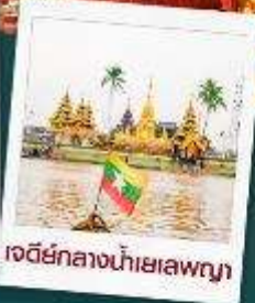
เจดีย์กลางน้ำเยเลพญา