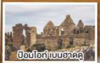
ป้อมโอ๊ก เบนฮาดดู