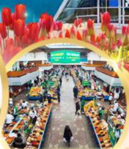
ตลาดกรีนบাজার