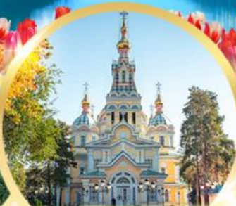
โบสถ์เซนต์คอฟ