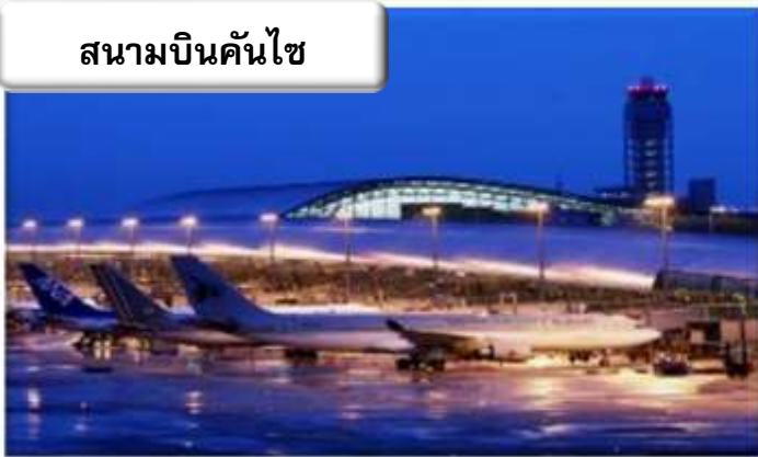
สนามบินคันไซ

เวลา 01.00 น. ออกเดินทางสู่ สนามบินคันไซ ประเทศญี่ปุ่น โดยสายการบินไทยแอร์เอเชียเอ็กซ์ เที่ยวบินที่ XJ 612