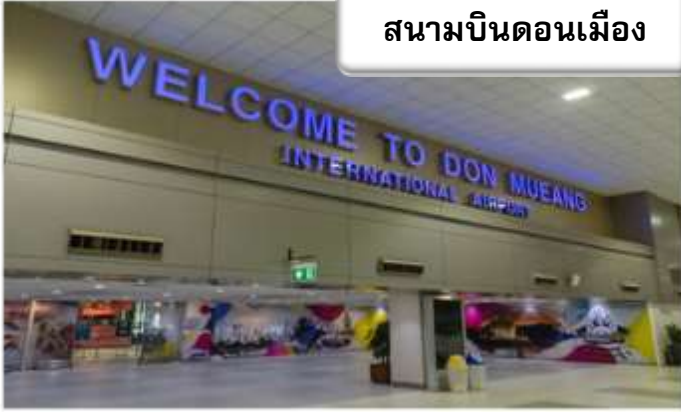
สนามบินดอนเมือง

เวลา 22.00 น. พร้อมกันที่ ท่าอากาศยานดอนเมือง อาคารผู้โดยสารขาออกระหว่างประเทศ เคาน์เตอร์ สายการบินไทยแอร์เอเชียเอ็กซ์ เจ้าหน้าที่คอยให้การต้อนรับ ดูแลด้านเอกสาร เช็คอิน และสัมภาระในการเดินทาง