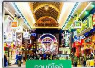
ทานุกิโคจิ