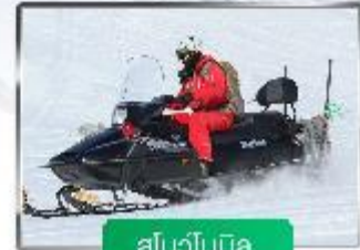
สโนว์โมบิล