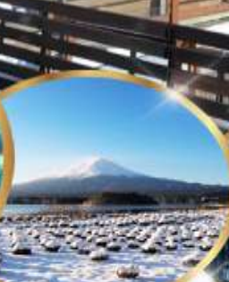
สวน ไออิชิ พาร์ค