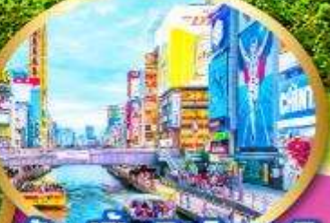
ช้อปปิ้งชินไซบาชิ