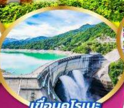
เขื่อนคุโรเบะ