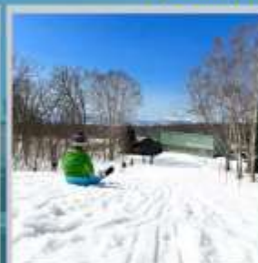
"NISEKO SKI RESORT"