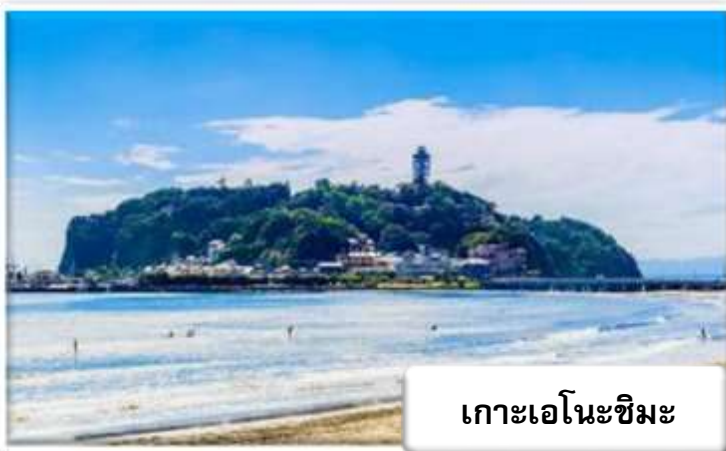
เกาะเอโนะชิมะ

ปราสาทโอดาวาระ - ล่องเรือทะเลสาบอาชิ - ออนเซน