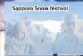
Sapporo Snow festival