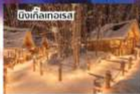
บึงเกลือเอวซ่า