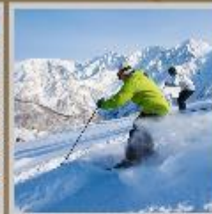
"HAKUBA SKI RESORT"