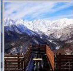
"HAKUBA MOUNTAIN HARBOR"