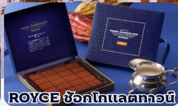
ROYCE ช็อกโกแลตทอว์น