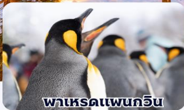
พาเหรดเพนกวิน