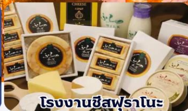
โรงงานชีสฟูรานะ