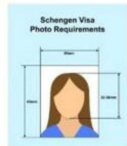
ตัวอย่างรูปถ่าย