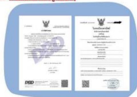
ตัวอย่างหนังสือจดทะเบียนบริษัท และ ใบทะเบียนพาณิชย์