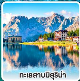
ทะเลสาบมิสุรีน่า

เข้าชมมหาวิหารเซนต์ปีเตอร์ ที่ใหญ่ที่สุดในโลกแห่งนครวาติกัน