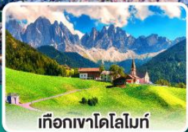
เทือกเขาโดโลไมท์