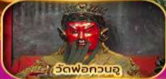
วัดพ่อกวนอู