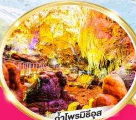
ท่าโพรมีธอส