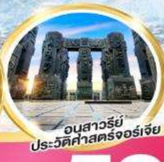
อนสาวรีย์ ประวัติศาสตร์จอร์เจีย