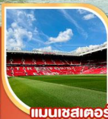
แมนเชสเตอร์