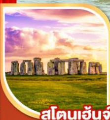
สโตนเฮ็นจ์