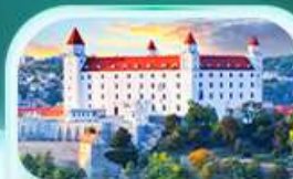
ปราสาทปราตีสลวา

เที่ยวชมเมืองออสเตรียที่หมู่บ้านริมทะเลสาบสวยที่สุดในโลก พระราชวังเชินบรุนน์ เมืองลินซ์ จิตรกรรมฝาผนังที่ สันติเมืองมรดกโลก เซสกี ครอบ เยี่ยมชมปราสาทปราก ถนนทองคำ เช็คอินสถานที่ชื่อดัง! ปราสาทปราตีสลวา ส่องเรือชมความงามแม่น้ำดานูบ แม่น้ำที่ยาวที่สุดในยุโรป ชมความน่าหลงใหลของ ปราสาทบูคาเปสต์ สะพานชาร์ลส์