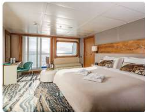
Balcony Suite Plus & Balcony Suite