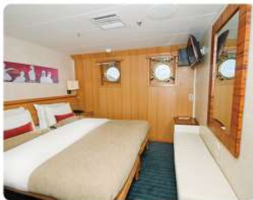
Junior Suite Plus & Junior Suite