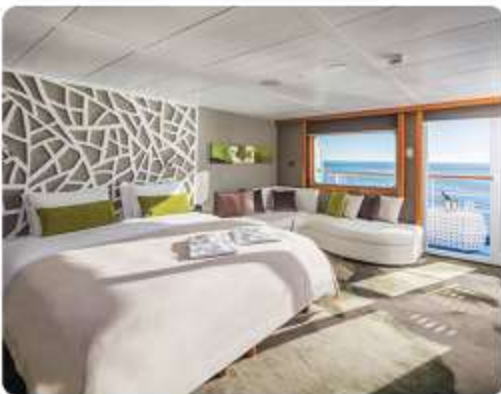
Legend Balcony Suite