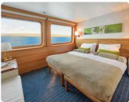
Junior Suite Plus & Junior Suite