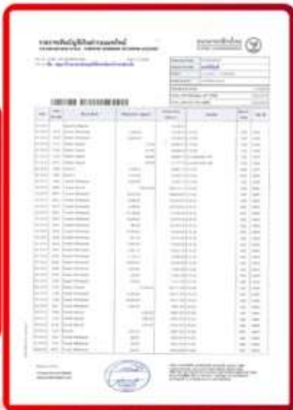
ตัวอย่าง Bank Statement ที่ผู้สมัครต้องยื่นต่อสถานทูต

3.4 ปรับสมุดบัญชีธนาคารตัวจริง และเตรียมไปในวันที่ยื่นวีซ่า