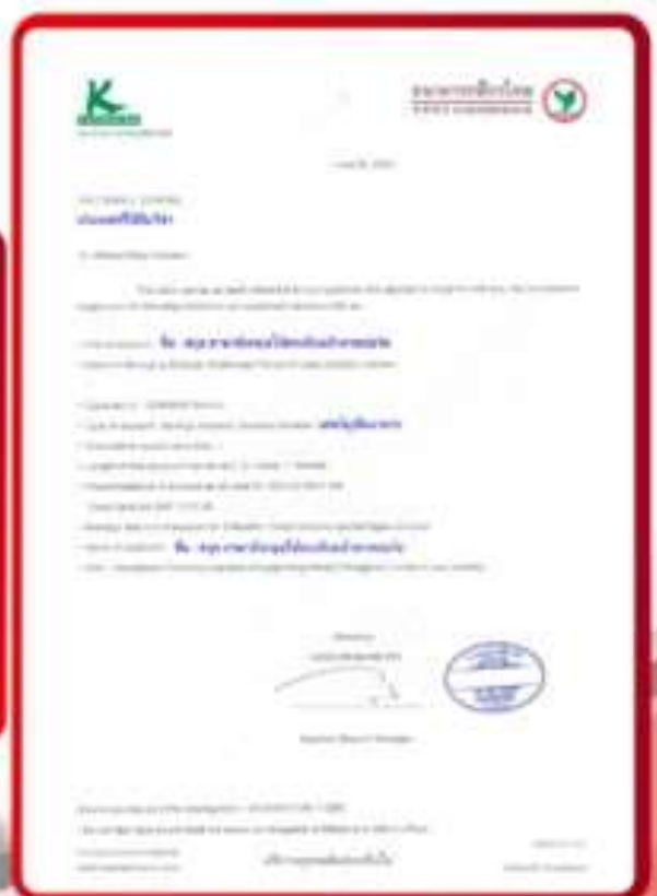
ตัวอย่าง Bank Guarantee ที่ผู้สมัครต้องยื่นต่อสถานทูต