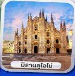
มิลานคูโอโม