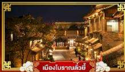
เมืองโบราณลั่วหยี่