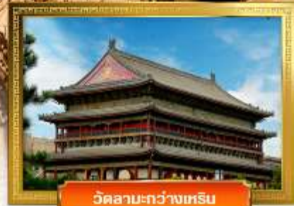
วัดลามะ-กว่างเหฺริน