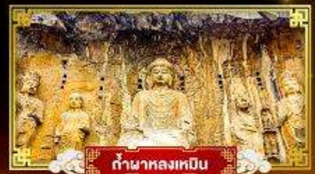
กำแพงหลงเหมิน