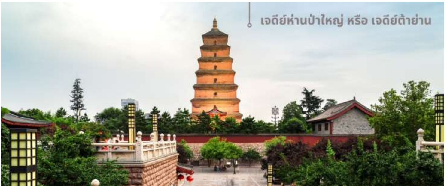
เจดีย์ห่านป่าใหญ่ หรือ เจดีย์ต้าย่าน

จากนั้นนำท่านเที่ยวชม เจดีย์ห่านป่าใหญ่ หรือ เจดีย์ต้าย่าน สถานที่ท่องเที่ยวระดับ 4A อายุมากกว่า 1,300 ปี ตั้งอยู่ในบริเวณวัดต้าฉือเอิน ซึ่งเป็นวัดสำคัญที่พระถังซำจั๋งเคยพำนัก ในตอนใต้ของเมืองซีอาน มณฑลฉ่านซี ตัวเจดีย์สร้างขึ้นใน ค.ศ.652 ในสมัยราชวงศ์ถัง โดยพระถังซำจั๋ง(หรือพระเสวียนจ้าง) ได้เสนอให้สร้างขึ้นเพื่อเก็บพระคัมภีร์และวัตถุที่ได้นำกลับมาจากชมพูทวีปในช่วงการเดินทางไปแสวงบุญที่อินเดีย เจดีย์ห่านป่าใหญ่มีความสูงประมาณ 64 เมตรในปัจจุบัน หลังผ่านการบูรณะและปรับปรุงหลายครั้ง โครงสร้างของเจดีย์ทำจากอิฐและมีการออกแบบที่เรียบง่ายแต่สง่างาม แสดงถึงสถาปัตยกรรมสมัยราชวงศ์ถัง แต่ด้วยเหตุแผ่นดินไหวในเวลาต่อมา บางส่วนของเจดีย์ถล่มลง ทำให้ปัจจุบันเหลือเพียง 7 ชั้นเท่านั้น ส่วนที่มาของชื่อเจดีย์ ตำนานเล่าว่ามีพระสงฆ์ในกลุ่มหนึ่งที่นับถือลัทธิแบบมหายาน เคยขาดแคลนอาหารอย่างหนัก วันหนึ่งพระสงฆ์เห็นฝูงห่านป่าบินผ่าน สงฆ์บางคนอธิษฐานต่อพระพุทธเจ้าให้พวกเขาได้รับอาหารเพียงพอสำหรับดำรงชีวิต ทันใดนั้น ห่านป่าตัวหนึ่งตกลงมาจากท้องฟ้าชนเข้ากับเจดีย์ ถึงแก่ความตาย เหล่าพระสงฆ์เชื่อว่าเป็นการสละร่างให้เป็นอาหาร จึงเชื่อกันว่าห่านตัวนั้นคือสัญลักษณ์ของพระเมตตา บ้างก็ว่าห่านตัวนั้นคือพระโพธิสัตว์ จึง