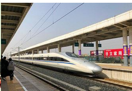
นิ่รถไฟความเร็วสูง