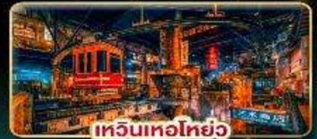
เทียนเหอโหย่ว