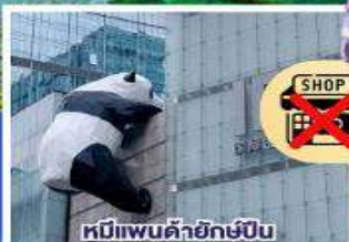
หมีแพนด้ายักษ์ปักกิ่ง ตึกถนนชุนชี่