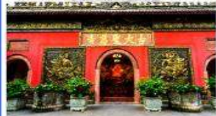
วัดต้าเจี๋ย