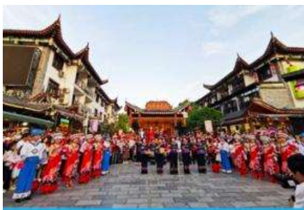
เมืองเทพริดา