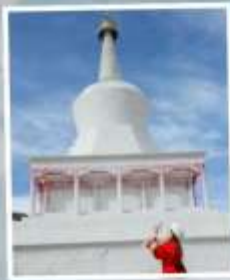
วัดลาปูหลุนสี่อ