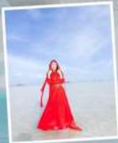
ทะเลสาบเกลือดาซ่า