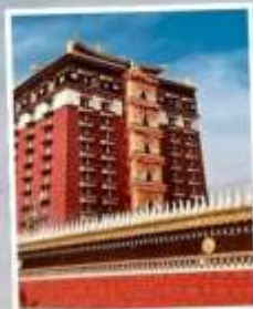
หอเก็บพระไตรปิฎก มิลารเปะ