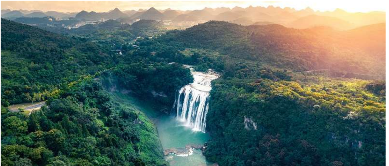
A panoramic view of the Huangguoshu Waterfall scenic area, Anshun, Guizhou Province. /CFP

นำท่านเข้าชม โซว์กลางคืนหวงกั๋วชู่ประกอบแสงสีเสียง (รวมลิฟท์ขึ้น-ลง) เพื่อยกระดับประสบการณ์ของนักท่องเที่ยว หน่วยงานท้องถิ่นได้สร้างพื้นที่แห่งใหม่ชมทิวทัศน์ โครงการทัวร์กลางคืนแสงและเงาที่หวงกั๋วชู่ อิงจากจุดชมวิวหุบเขาธรรมชาติ ได้รับการเปิดตัวอย่างเป็นทางการในปี 2021 ด้วยการไฮเทคโนโลยีแสงสีเสียงและแสงเงา ผู้มาเยือนได้สัมผัสประสบการณ์การเดินทางที่มีสีสัน ชื่นชมความงามอันบริสุทธิ์ ที่มีความกลมกลืนระหว่างธรรมชาติและมนุษย์ มีเสน่ห์ของประวัติศาสตร์และวัฒนธรรมท้องถิ่น ชมการแสดงเต้นรำและร้องเพลงของชนชาติส่วนน้อยเจ้าของพื้นที่ กล่าวได้ว่า "ทัวร์กลางคืนหวงกั๋วชู่" สามารถดึงดูดนักท่องเที่ยวได้ประมาณ 180,000 คนในปี 2023