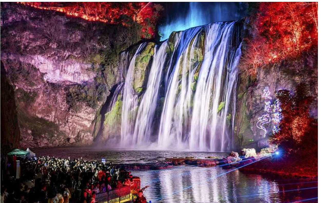
A colorful night view is captured at the Huangguoshu Waterfall scenic area, Anshun, Guizhou Province. https://news.cgtn.com/news/2024-05-30/Night-Tour-at-Huangguoshu-show-takes-visitors-on-a-colorful-trip