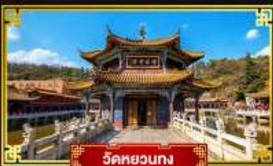
วัดหยวงง