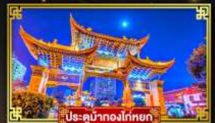
ประตูม่านทองโตเกียว