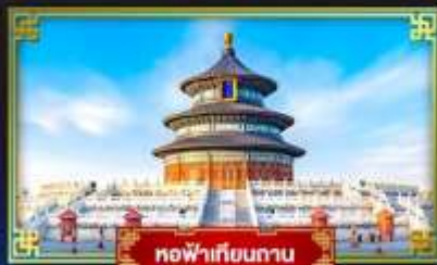
หอฟ้าเทียนถาน