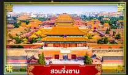
สวนจิ่งซาน