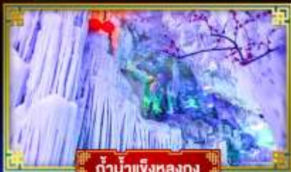
ตำนานเงี้ยวหลงทง