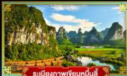
ระเบียบภาพเขียนหมิงฮี้