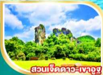
สวนเจ็ดดาว-เขาอู๋