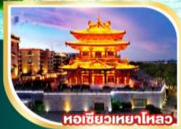
หอชิวเหยาไหล