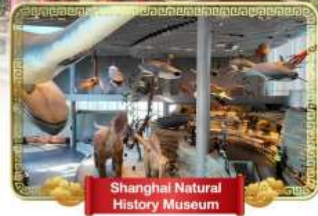
Shanghai Natural History Museum