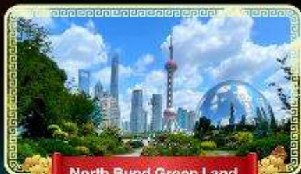
North Bund Green Land