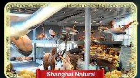
Shanghai Natural History Museum