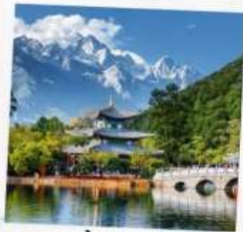
สระน้ำมังกรดำ