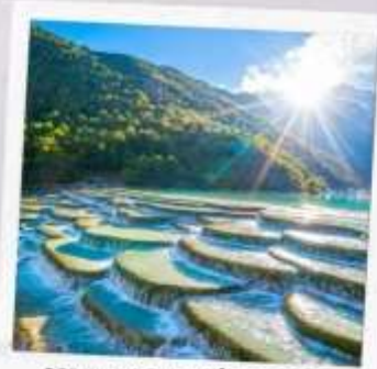
หุบเขาพระจันทร์ สีน้ำเงิน