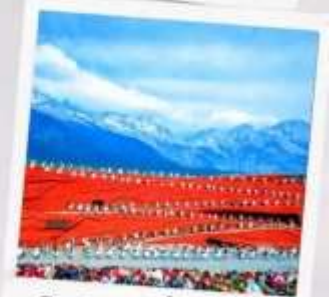
โชว์ จางอีโหมว