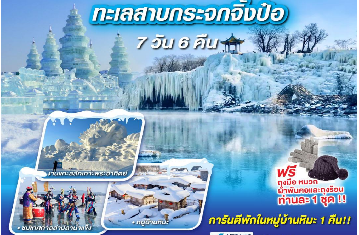
งานแกะสลักเกาะพระอาทิตย์