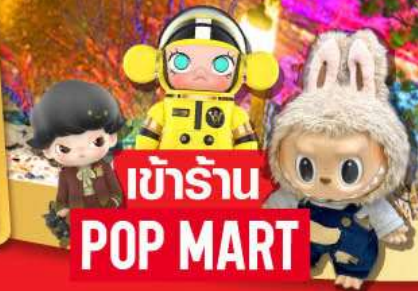
เข้าร้าน POP MART