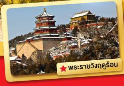
★ พระราชวังฤดูร้อน