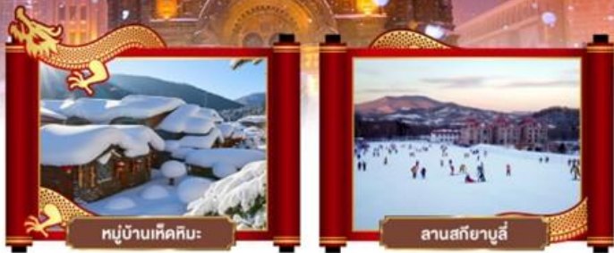
หมู่บ้านหิมะหิมะ