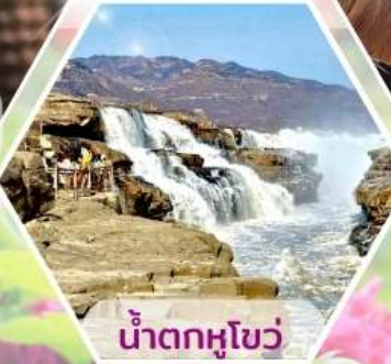
น้ำตกหูโซ่ว