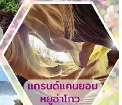
แกรนด์แคนยอน หยูจ่าโกว