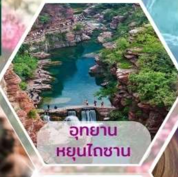
อุทยาน หยุนโตซาน