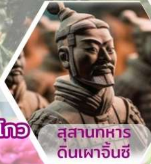
สุสานทหาร ดินเผาจีนซี