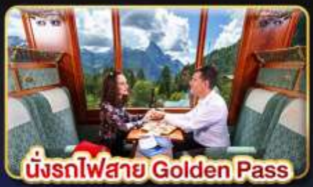
นั่งรถไฟสาย Golden Pass