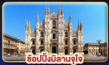
ช้อปปิ้งมิลานจุใจ

📅 เดินทาง : 9-16 ก.พ. / 9-16 มี.ค. / 23-30 มี.ค. 68